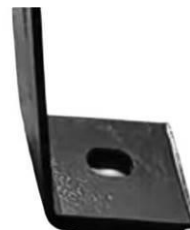
Рис. 3. Нижняя часть ножки

Ножки имеют отверстия в нижней части для возможности крепления подставки к твердому полу (рис. 3). Крепеж в комплект не входит.