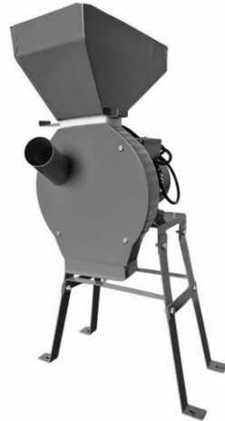
Рис. 1. Пример установки зернодробилки на подставку.

Верхнее основание подставки имеет монтажные отверстия для крепления зернодробилки (рис. 2). Крепеж в комплект не входит.