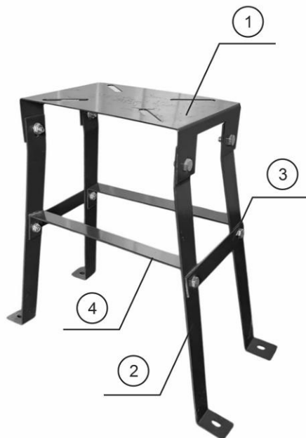
Таблица 1. Комплектация подставки «Стенд-1».