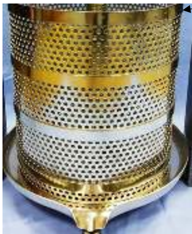
Рис. 2 Установка корпуса

7.2. Установить корпус в тарелку как показано на рис. 2 ободом вверх.