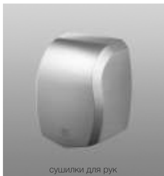
сушилки для рук