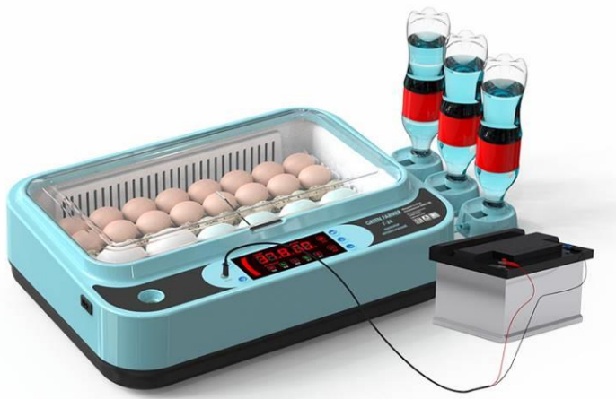
Рис. 3. Схема подключения инкубатора к резервному аккумулятору 12В

ВАЖНО! При использовании аккумулятора яйца следует переворачивать вручную, так как механизм поворота роликов отключается. Аккумулятор 12В в комплект НЕ ВХОДИТ.