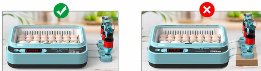
Рис. 7. Схема установки системы автодолива

Диапазон допустимой влажности на всем протяжении инкубации составляет примерно 50 - 85%, небольшие перепады - допускаются.