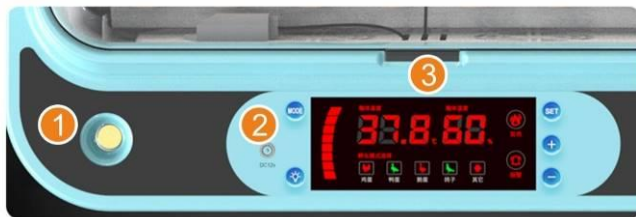
Рис. 2. Схема блока управления.