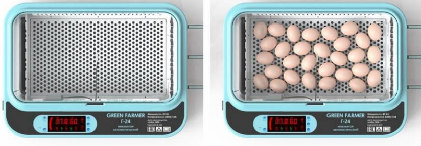
Рис. 9. Пример размещения яиц на инкубационной сетке.