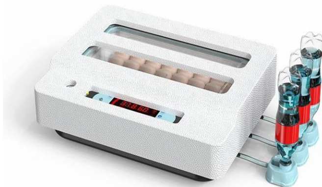
Рис. 8. Схема установки пенопластового короба на инкубатор.

Для того чтобы отключить сигнал тревоги – необходимо нажать на кнопку «-»