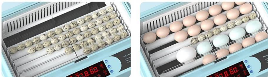
Рис. 4. Пример размещения яиц на роликах.

Вместимость лотка инкубатора (зависит от индивидуальных размеров яиц), шт