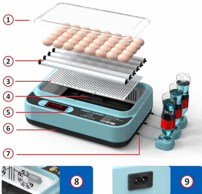
Рис. 1. Устройство инкубатора.