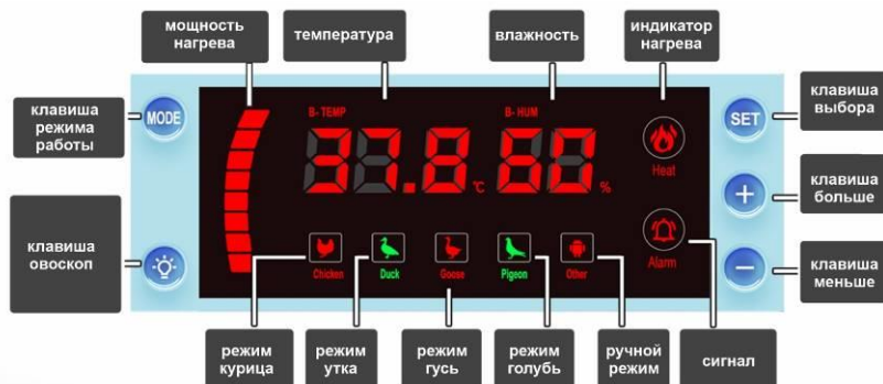
Рис. 5. Панель управления режимами инкубации.