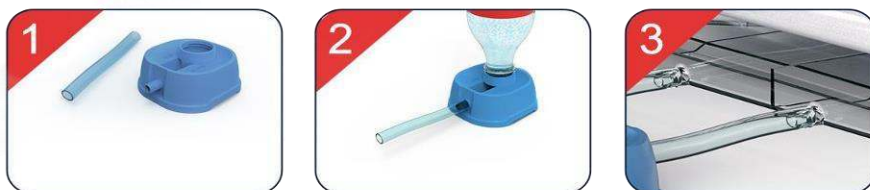
Рис. 6. Схема подключения системы автодолива

Основание платформ автодолива воды должны быть в одной плоскости с основанием инкубатора (рис. 6)