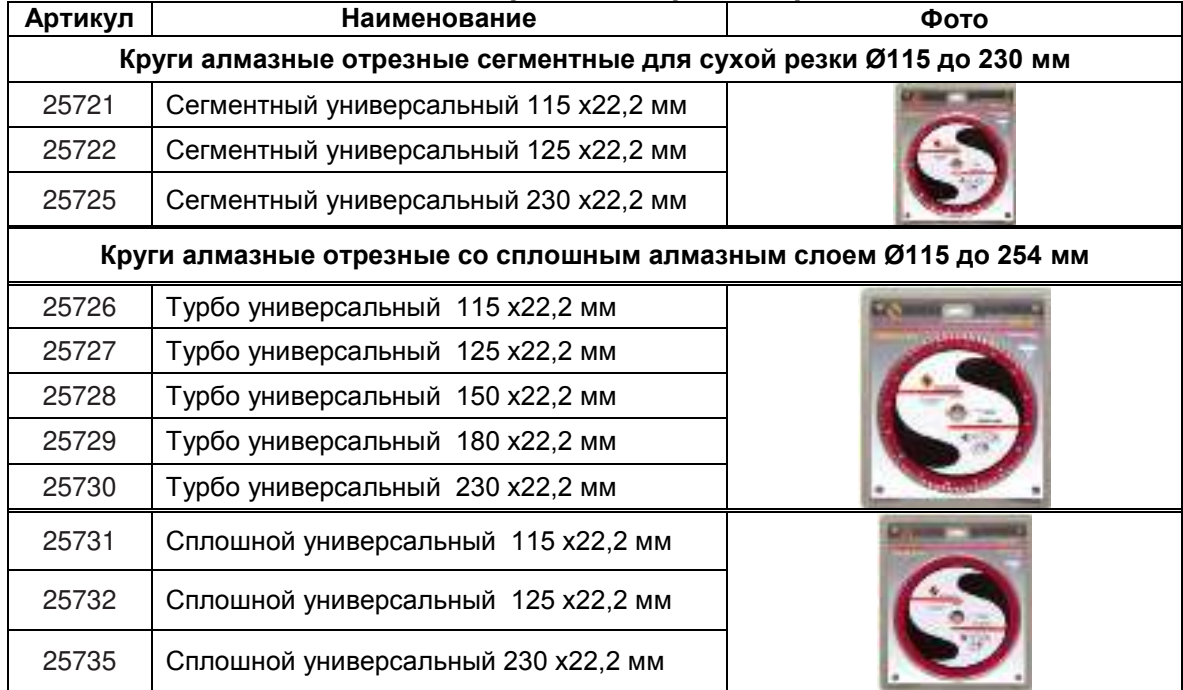
Серия «Энкор Эксперт»