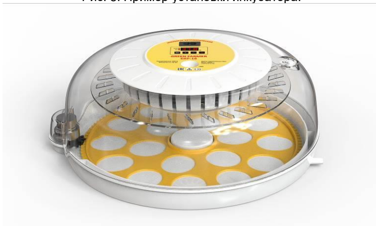
Рис. 3. Пример установки инкубатора.

Укладка яиц в инкубатор производится путем размещения их в ячейках лотка по 1 или 2 шт. в ячейке в зависимости от вида.