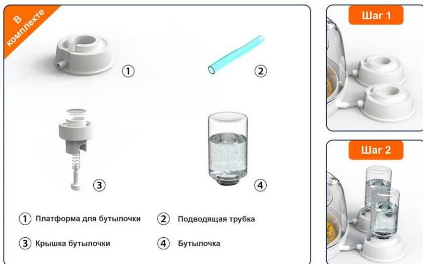
Рис. 6. Схема подключения системы автодолива

Основание платформ автодолива воды должны быть в одной плоскости с основанием инкубатора (рис. 7)