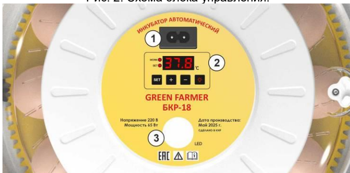
Рис. 2. Схема блока управления.