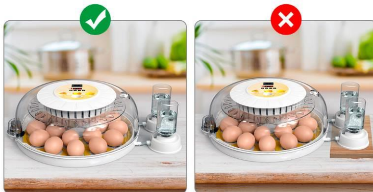
Рис. 7. Схема установки системы автодолива

Диапазон допустимой влажности на всем протяжении инкубации составляет примерно 50 - 85%, небольшие перепады - допускаются.