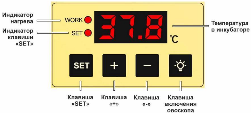
Рис. 5. Панель управления инкубации.

1. Значение температуры по умолчанию 37,8°C (это заводская настройка, необходимая для инкубации яиц без донаторки). Если необходимо изменить температуру в инкубаторе, нажмите клавишу SET. На дисплее начнет мигать число, нажимайте "+" или "-", чтобы настроить температуру. Снова нажмите клавишу SET для завершения настройки температуры.