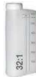
Канистра для приготовления топливной смеси (мерная шкала на канистре позволяет приготовить топливную смесь в необходимых пропорциях)