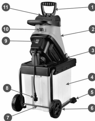
Рис. 2. Устройство модели ESH-45box