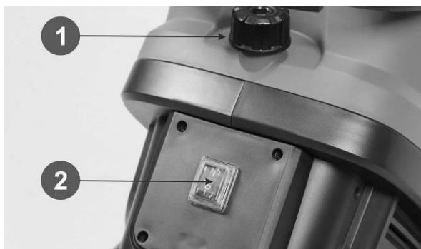
Рис. 3. Винт крепления и выключатель.