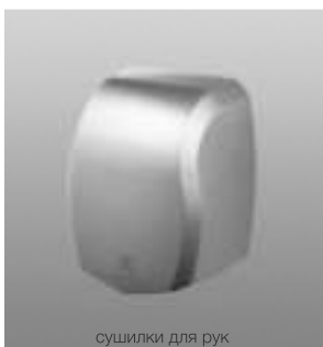
сушилки для рук