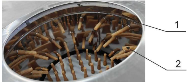
Рис. 2. Устройство барабана.