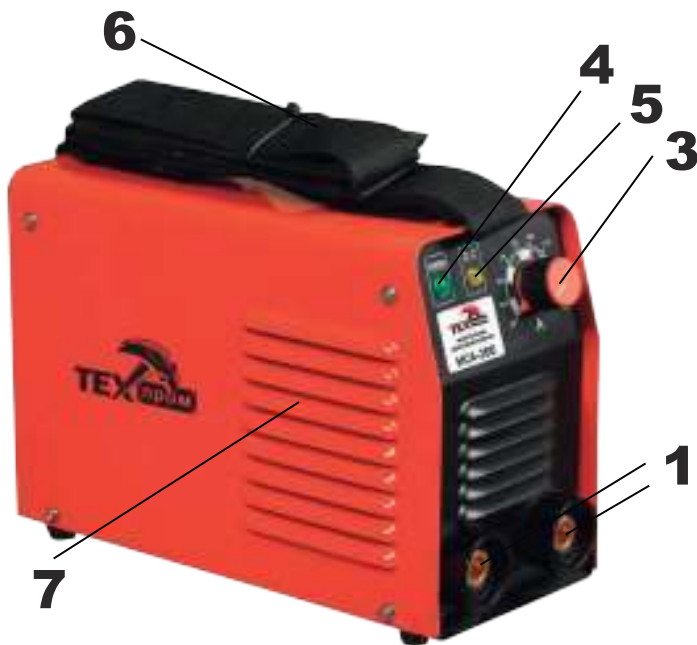
Рис 1. Внешний вид.

Этот сварочный аппарат является источником тока для ручной дуговой сварки и выполнен специально для сварки методом MMA на постоянном токе (DC). Данный аппарат собран на IGBT транзисторах (англ. Insulated Gate Bipolar Transistor — биполярный транзистор с изолированным затвором). Отличительным качеством данного аппарата являются такие особенности как высокая скорость сварки (при хорошей квалификации оператора), точность регулирования, высокий процент включения, и инверторное преобразование тока, которые обеспечивают сварочному аппарату прекрасные качества сварки, со всеми покрытиями электродов (рутиловые, кислотные, щелочные) даже при незначительном опыте оператора, благодаря функциям помощи при работе: HOT START, ARC-FORCE, ANTI STICK.