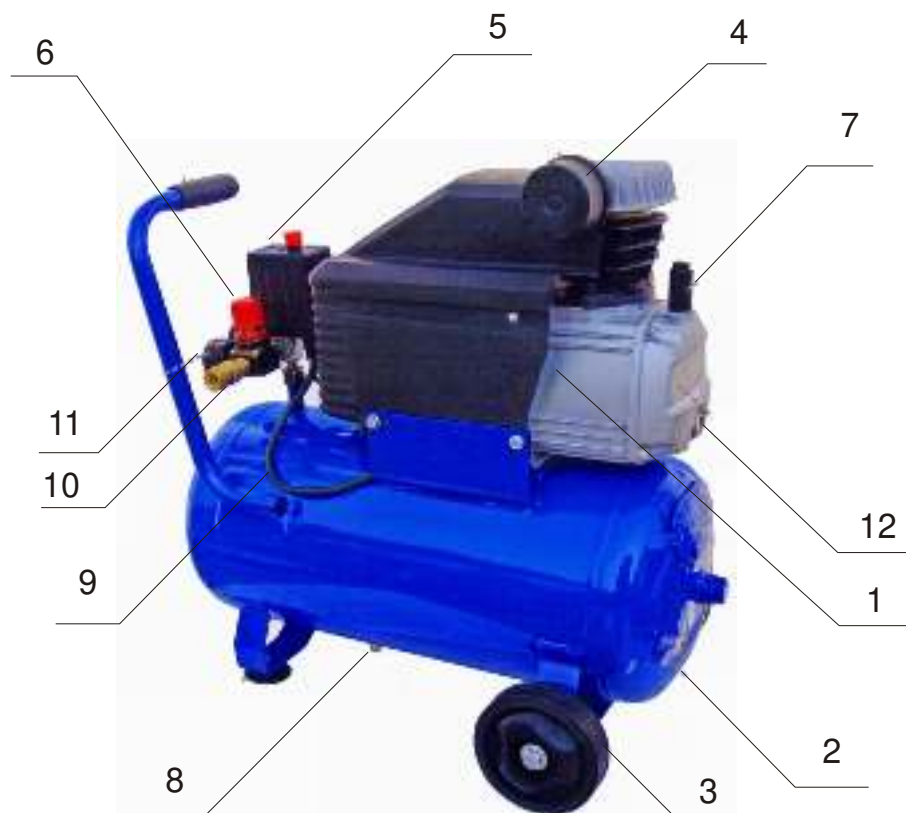
Рис. 1. Общий вид компрессорной установки

Манометр - предназначен для контроля давления в ресивере и, или на выходе из редуктора-регулятора.